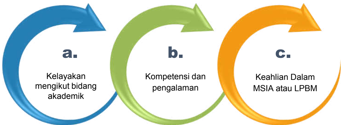
Rajah 11.3: Kriteria Orang yang Berkelayakan

Tiga kriteria orang berkelayakan telah digariskan bagi memudahkan proses saringan untuk pemilihan peserta bagi Modul Penilaian Kursus Kompetensi SIA seperti Rajah 11.3: