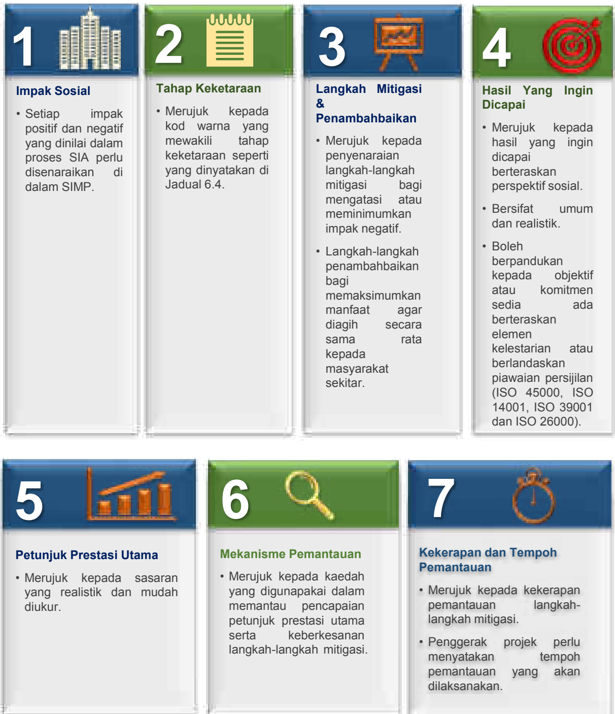
Rajah 7.4: Elemen Penting Rangka Kerja Pemantauan oleh Pengerak Projek

Rangka kerja pemantauan oleh penggerak projek disediakan dalam bentuk jadual dengan memperincikan setiap elemen penting yang ditunjukkan dalam Rajah 7.4. Contoh rangka kerja pemantauan tersebut adalah seperti ditunjukkan dalam Jadual 7.1. Jadual ini diguna pakai semasa pelaksanaan dan pemantauan langkah mitigasi untuk setiap impak sosial yang dikenal pasti.