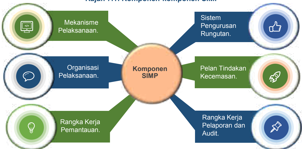
Rajah 7.1: Komponen-komponen SIMP

SIMP bersama langkah mitigasi yang digariskan dalam Laporan SIA akan diambil kira sebagai syarat di dalam kelulusan Laporan SIA dan kelulusan kebenaran merancang (KM).