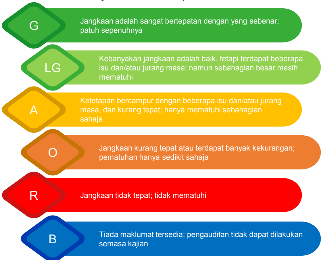
Rajah 9.3: Matriks Pelaporan Audit